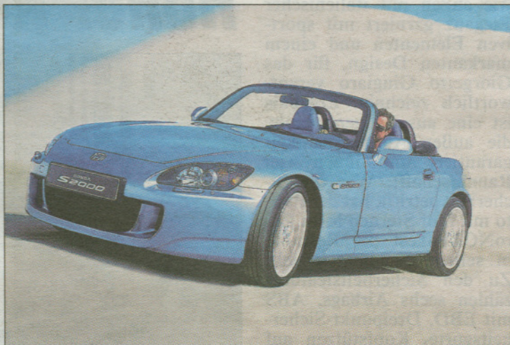
Der Honda Roadster fährt jetzt mit neuem Look vor.